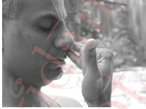
Part 1 రేచక

In the third part, keep the left nostril closed with the ring finger and exhale through the right nostril. Say ఓం and touch the right ear. Figure 3 shows the three parts of ప్రాణాయామం.