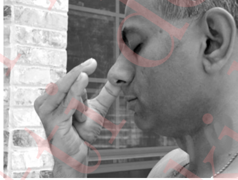
Part 2 పూరక