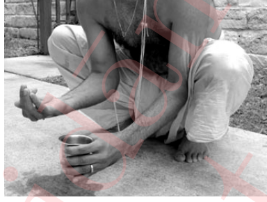
Figure 2: ఆచమనం.

Sit in the కుక్కుటాసన posture with hands between the legs, as shown in Fig. 2.