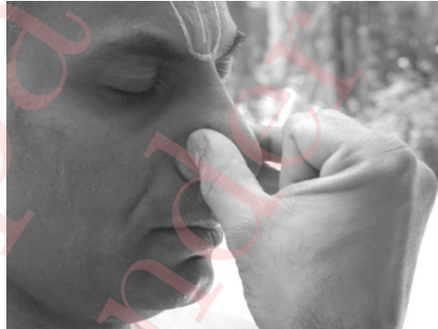
Part 3 కుంభక