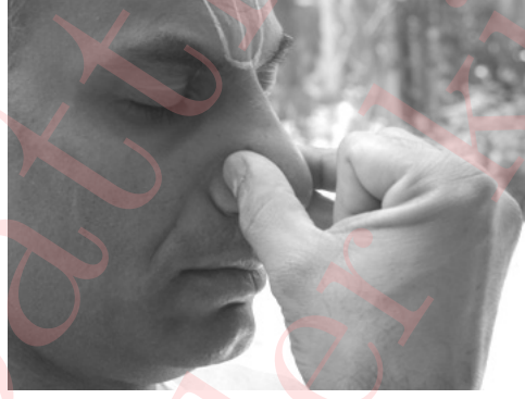
Part 3 कुम्भक