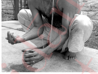
Figure 2: आचमनम्.

Sit in the कुक्कुटासन posture with hands between the legs, as shown in Fig. 2.