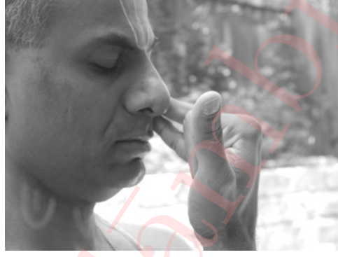
Part 1 रेचक