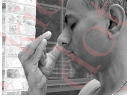
Part 2 पूरक