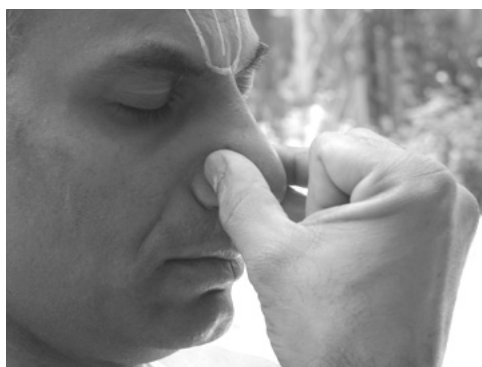
Part 3 കുന്ദക