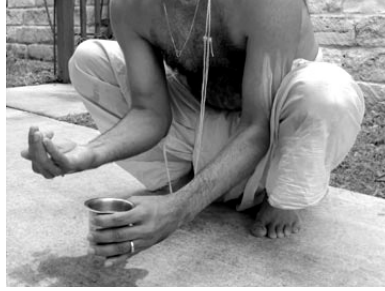
Figure 2: ആചമനം.

Sit in the കൂക്കുടാനന posture with hands between the legs, as shown in Fig. 2.