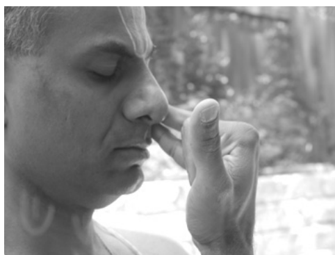
Part 1 രോചക